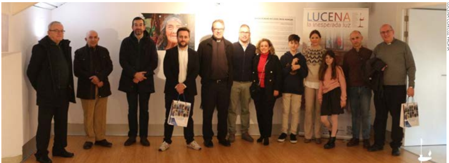
LUCENA CON LUZ PROPIA

El horario para visitar la exposición, que estará abierta hasta el 15 de diciembre, será de lunes a sábado de 10:30 a 14:00 y de 17:00 a 20:00, y el domingo de 10:30 a 14:00 horas.